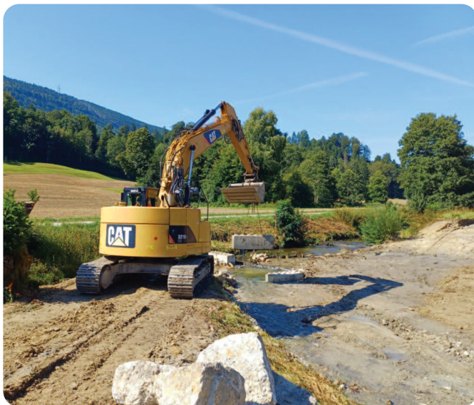
Mise en eau du nouveau tracé de la Birse