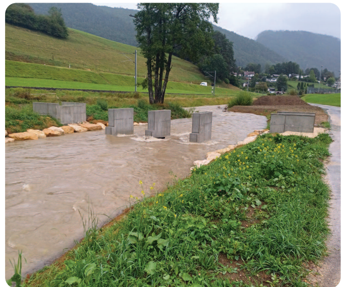
Deux jours après la mise en eau