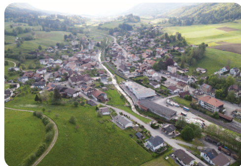
en Assemblée municipale en décembre 2025.

Le dossier devrait donc pouvoir être déposé très prochainement à l'OACOT pour un examen préalable. Selon toute vraisemblance, les délais de consultation devraient nous amener à procéder au dépôt public en été 2025 et nous espérons pouvoir boucler ce dossier en présentant ce dernier pour validation